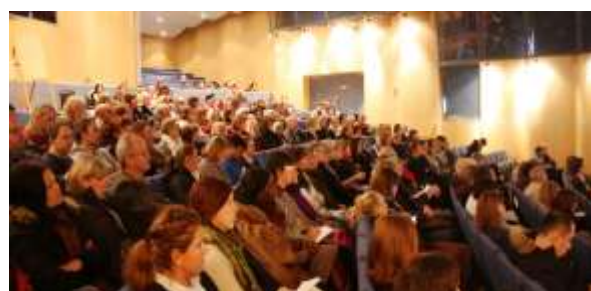
Intresset var stort när psykiatrimottagningen i Huddinge höll en utbildningsdag om psykossjukdomar.

"Mycket bra initiativ att samla alla "myndigheter" med dess handläggare vilket kan möjliggöra vidare samarbete och inte endast samverkan. Detta är troligen en av våra största utmaningar givet dessa målgrupper." Deltagare 9 februari